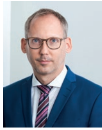
Kai Klose Hessischer Minister für Soziales und Integration